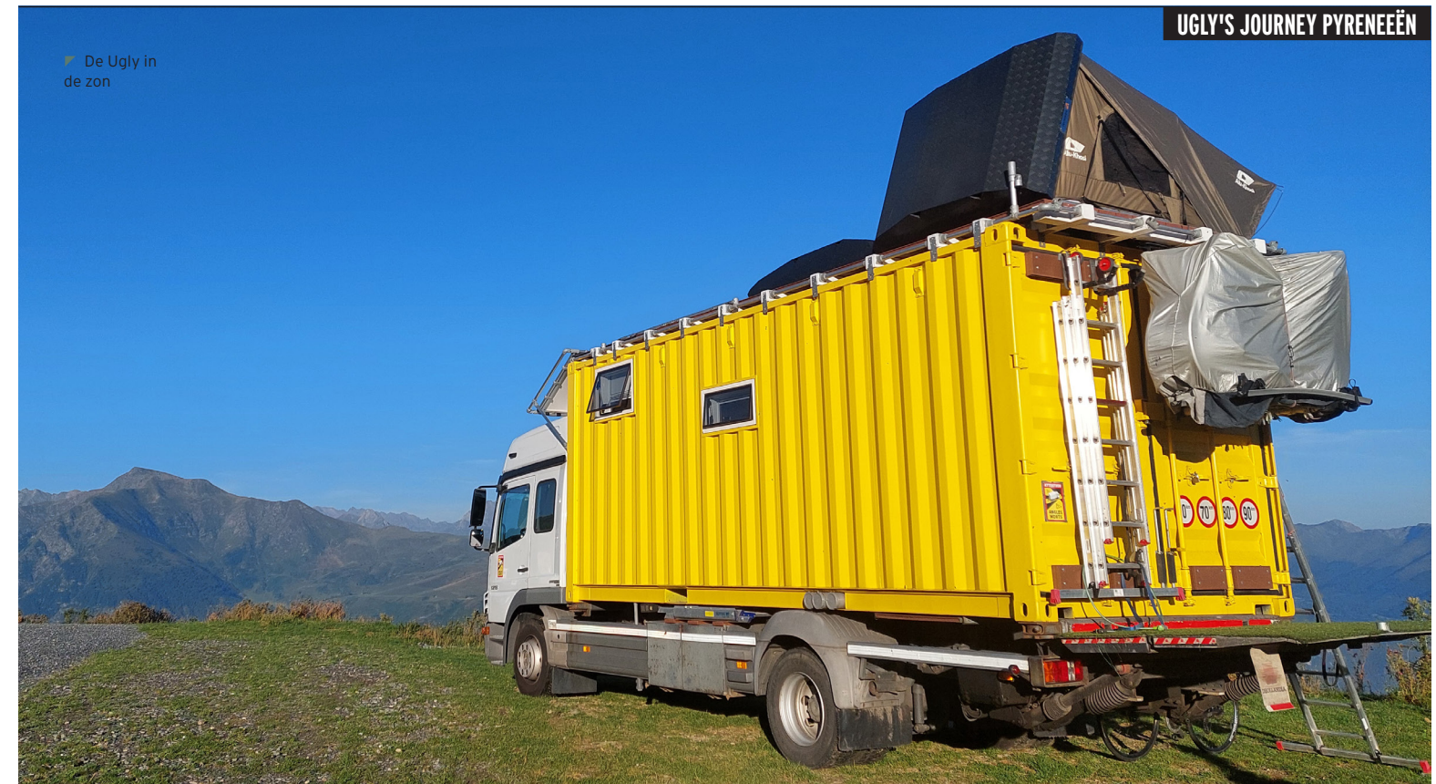
De Ugly in de zon