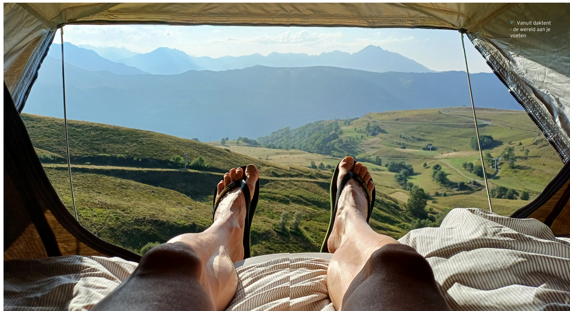
▼ Vanuit daktent - de wereld aan je voeten

De ochtend erna is het nog steeds stralend weer en daal ik na een vorstelijk ontbijt via de andere kant van de Peyresourde af naar een nieuwe vallei. Het is niet de lastigste afdaling, want die heb ik vannacht al gehad vanuit m'n daktent. Die is te bereiken – en dus ook te verlaten – met een ladder. Als de natuur 's nachts roept is dat even lastig, maar dankzij een hoofdlampje is het ook zeker geen Mission Impossible, om in cinematografische sferen te blijven. Bovendien: wie op de top van een berg kampeert, moet een beetje avontuurlijk zijn ingesteld! En vergeleken bij al het klimwerk dat me vandaag op de fiets wacht, is het al helemaal een peulenschil.