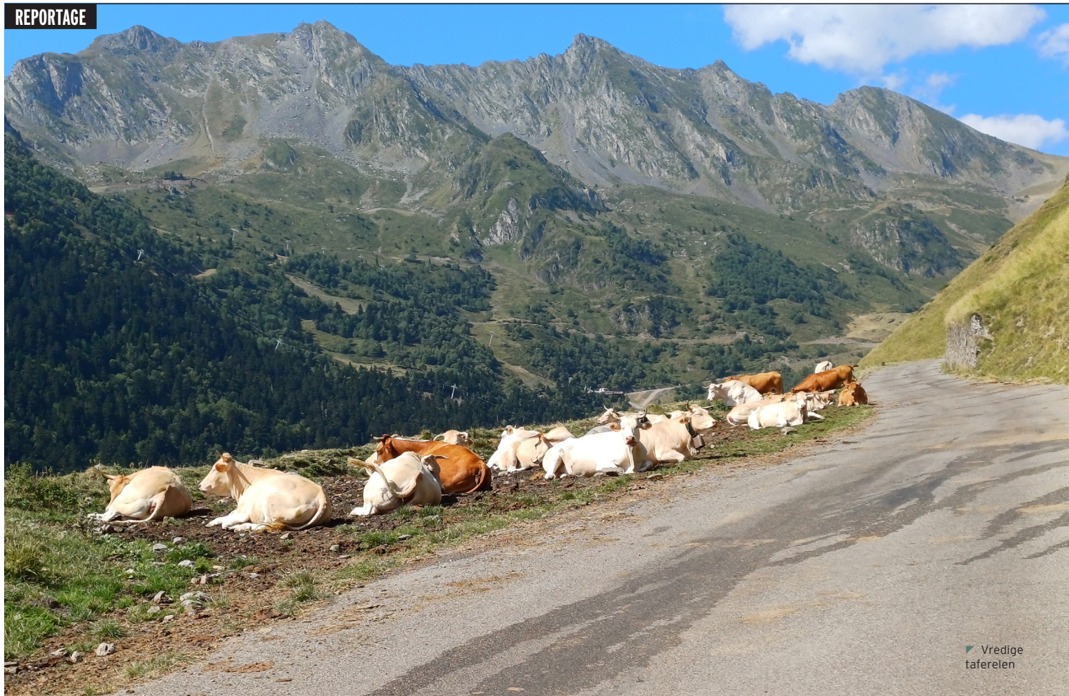
▼ Vredige tafereelen

voel ik de voortekenen van kramp in m'n bovenbenen. Ik schakel direct terug naar het kleinste verzet dat ik heb, maal nog even door in de verzengende hitte en probeer op de top wat te herstellen met een cola.